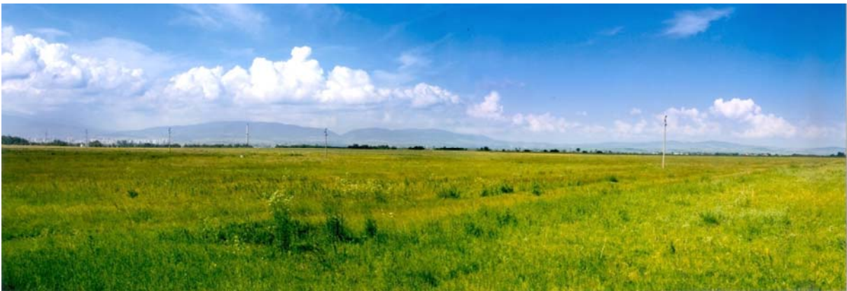
Панорама на местоположението