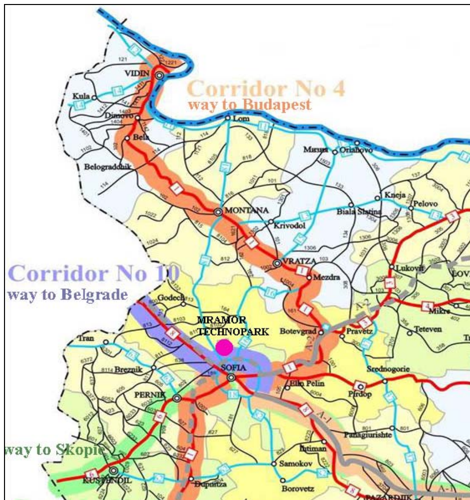
Карта на местоположението

Местоположение: бул. Ломско шосе, 10 км. От центъра на София Районът се характеризира с близост до основните подходи към централната градска част и благоприятно разположение спрямо международните транспортни коридори.